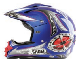
ÉQUIPEMENT DE SPORT